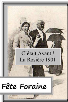
C'était Avant ! La Rosière 1901

1821 : célébration de la première Rosière