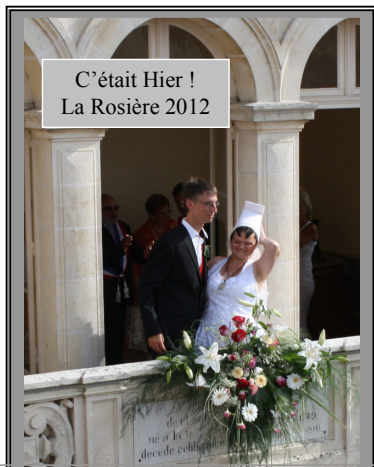
C'était Hier ! La Rosière 2012

Course pédestre, Cavalcade et Fête foraine